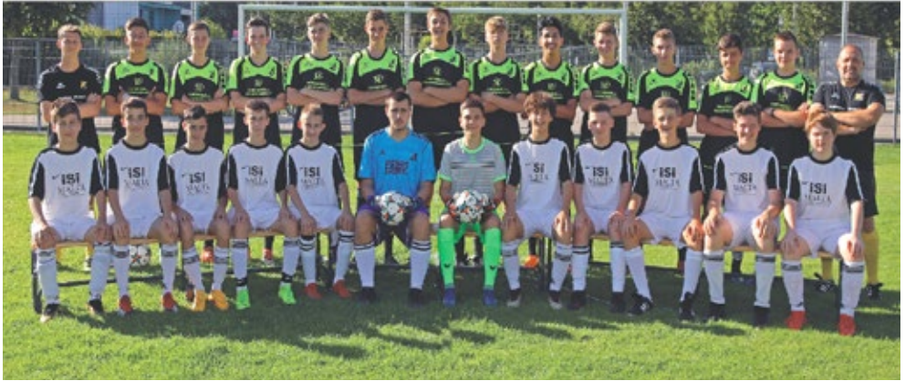
Unser Flaggschiff: Die B1 der (SG) SV Mammendorf/FC Aich mit einer überragenden Vorrunde

Der aufmerksame Leser hat sicherlich bemerkt, dass die B1 ungenannt blieb. Ihnen gehören einige Worte mehr.