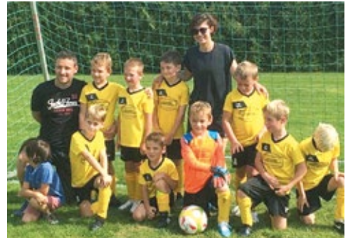
Die F2 glücklos aber kämpferisch vorbildlich!