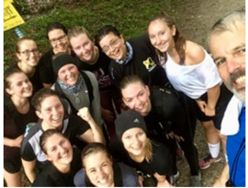
Vorbereitung auf dem Trimm-Dich-Pfad