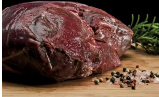
Rehkeule ohne Knochen 3,00 €/100 g