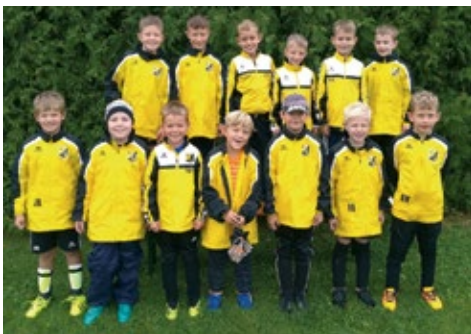
Zeigten eine respektable Leistung: F1

Im Sparkassencup erreichten die 3 Großfeldmannschaften das Achtelfinale. In der nächsten Runde treffen sie allerdings auf höherklassige Gegner. Aber selbst das ist noch nicht das Ende der Fahnenstange, denn in der Vorrunde wurde ja bewiesen, dass man gegen (vermeintliche) Favoriten gewinnen kann.