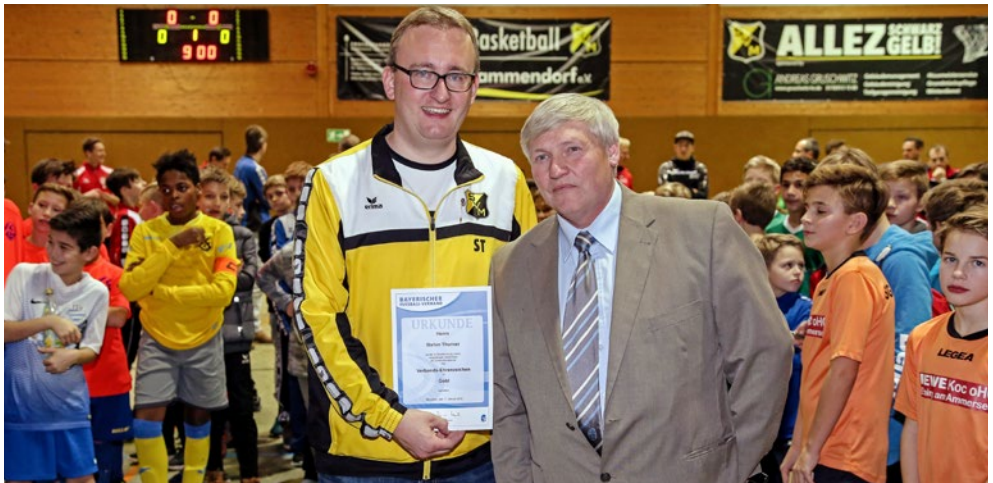
Autor: Hans Kürzl, Tagblatt FFB

Die haben das im Kreuz“, so Huppmann gleichermaßen salopp wie anerkennend. Auch der Münchner Merkur hat das bereits erfahren, als er das große Merkur CUP-Finale von 2016 nach Mammendorf vergeben hatte. Bei neuen technischen Herausforderungen zeigt sich der 40-jährige Thurner, Sohn des früheren Mammendorfer Bürgermeisters, stets auf Ballhöhe. Bei den Hallenmeisterschaften auf Kreisebene informierte er via Liveticker die Außenwelt von den aktuellen Geschehnissen unterm Dach. Dass es funktionierte, sei aber nicht sein Verdienst, so Thurner mit gewohnter Ruhe und Souveränität. „Dazu braucht es ein gutes Team“, so der SVJugendleiter. Immerhin seien dann Liveticker, Zeitmessung und Durchsagen gleichzeitig zu bewältigen. Die Hürde für das Verbands-Ehrenzeichen in Gold ist hoch. Der BFV vergibt die Auszeichnung entweder nach 40 Mitgliedschaft im Verein oder „für eine verdienstvolle 20-jährige Funktionärstätigkeit im Verein“ wie es in der Ehrenordnung des Verbandes heißt.