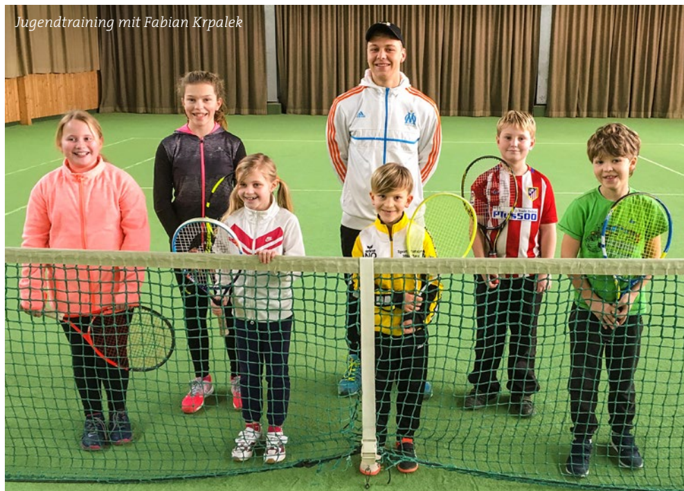
Jugendtraining mit Fabian Krpalek