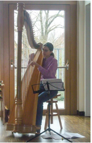
Danke für die musikalische weihnachtliche Stimmung.