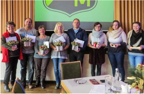
Danke an die helfenden Hände das ganze Trainingsjahr.